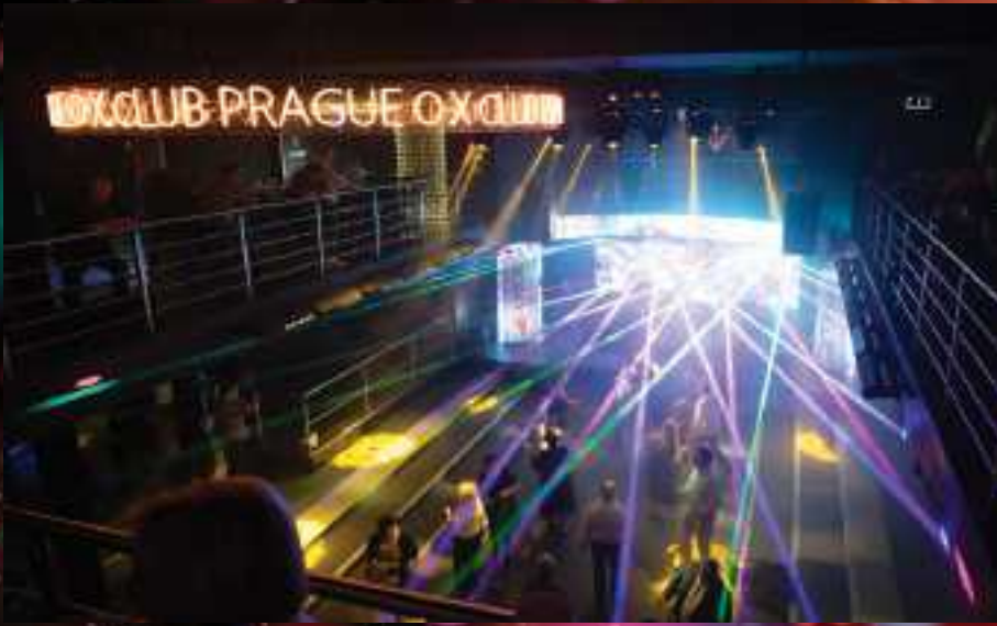
Taneční parket se během večera rychle zaplnil.