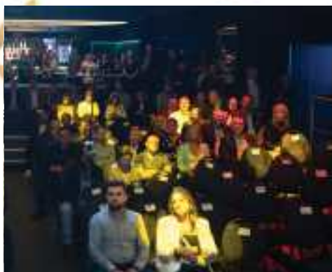
Oslavy se konaly v prostorách OX Club Prague.