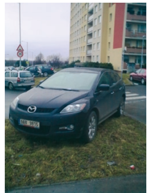
Stání na trávníku.