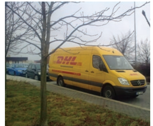
Další vozidlo, které zřejmě nepatří k rezidentům.