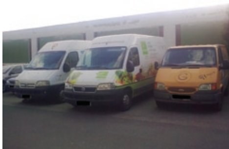
Patří firemní dodávky k rezidentům zdejší lokality?

Aby ale mohli obyvatelé – rezidenti pokud možno bez problémů zaparkovat ve svém bydlíšti, vyvstává logická otázka, kdo zaplatí nová potřebná parkovací místa? Obce, jakou je i naše městská část, to za současné ekonomické situace zřejmě ze svých rozpočtů hradit nebudou a soukromí investoři se do výstavby rovněž nehrnou. V jednom z posledních čísel zpravodaje Krok byl popsán způsob družstevní výstavby bytů, jehož způsob lze aplikovat i při výstavbě parkovacích domů. Za předpokladu složení členského podílu ve výši okolo 30 % pořizovací ceny, splátky dlouhodobě rozložené do několika let, a to vše bez doložení výše příjmu, může zájemce získat finančně dostupné parkovací místo. Předpokladem je nalezení formy spolupráce mezi městskou částí a takovýmto potenciálním investorem. Pozemky k tomuto účelu na Praze 13 zatím ještě existují a jsou ve vlastnictví nebo správě Prahy 13, anebo ve vlastnictví Magistrátu hl. m. Prahy, který by jistě ochotně na žádost naší městské části takovéto pozemky svěřil do její péče.