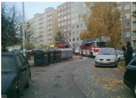
Hasiči na Velké Ohradě tentokrát ještě projeli.