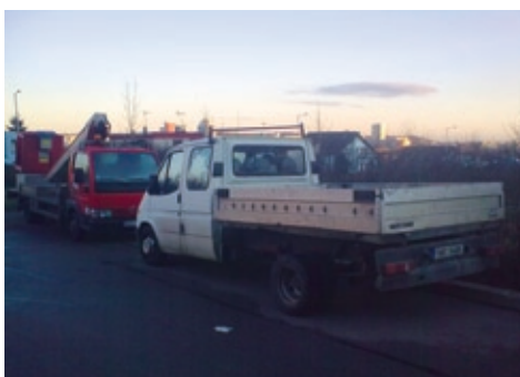
Nákladní vozidla k rezidentům také nepatří.