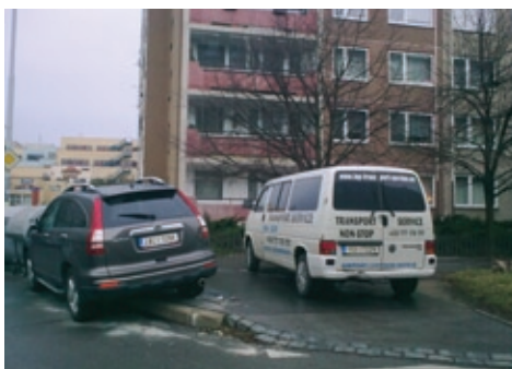
Nepovolené stání na chodníku.

Mimochodem mnoho obyvatel Prahy 13 žije v domech postavených v minulosti například Stavebním bytovým družstvem POKROK, které i nadále tyto domy spravuje. Podle informací našeho sdružení má družstvo zájem pomoci svým členům při řešení problémů s parkováním v jejich bydlíšti.