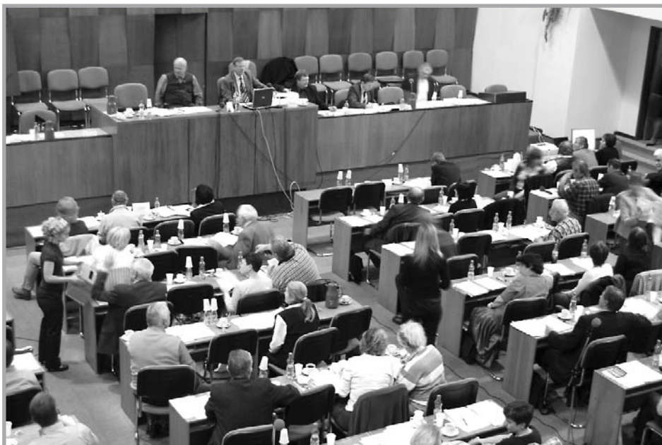
Shromáždění delegátů SBD POKROK probíhá už tradičně v Domě odborových svazů na náměstí W. Churchilla.

Po obvyklých procedurálních a čistě technických záležitostech (např. registrace, zajištěná jako obvykle společností Centin, stejně jako později všechna hlasování) bylo v 9 hodin zahájeno jednání za účasti 139 delegátů, tedy 75 % ze 183 pozvaných (později se jejich počet přiblížil