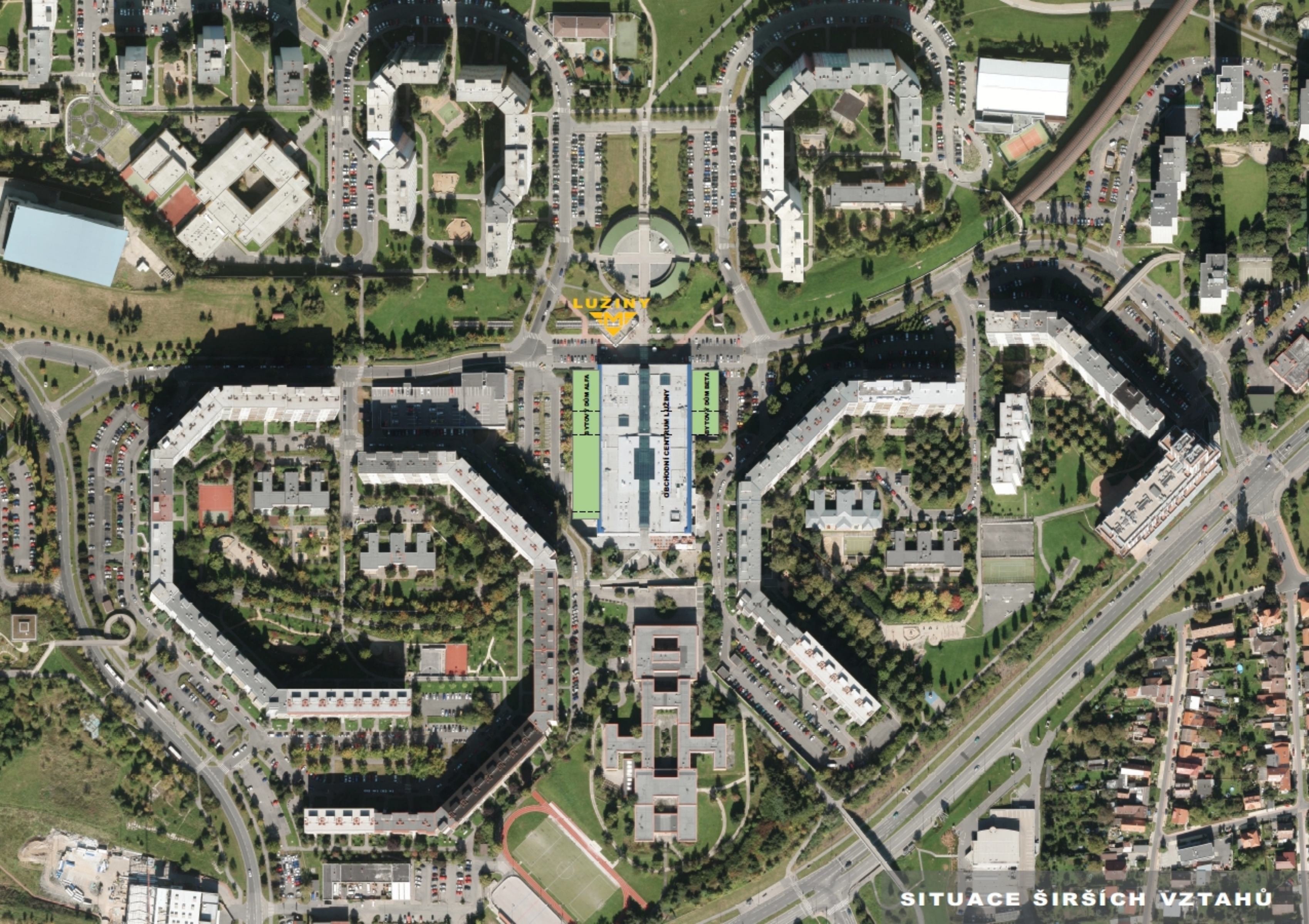
SITUACE ŠIRŠÍCH VZTAHŮ